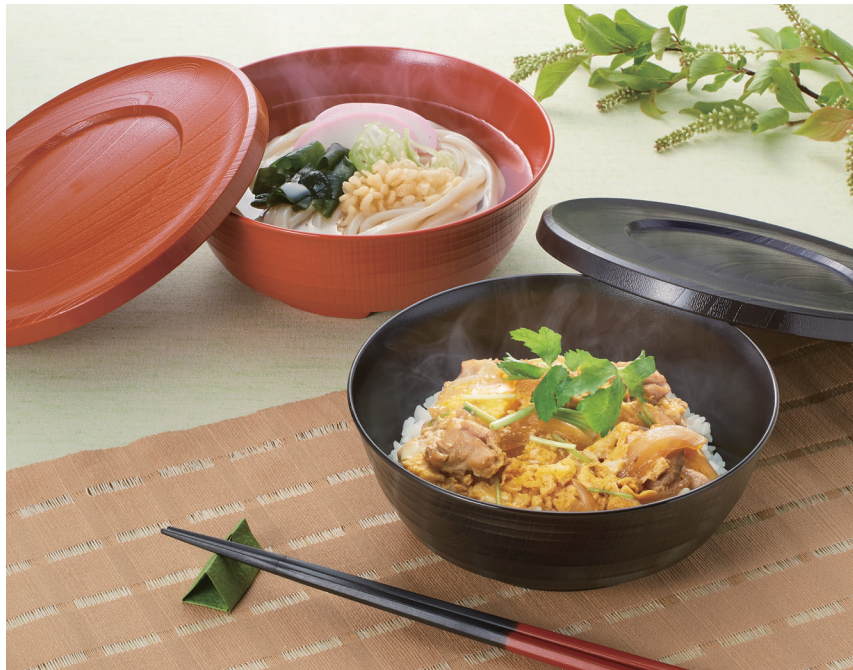
使用食器 | U-97 SYU・U-96 SYU 丼、U-97 KTI・U-96 KTI 丼、TH-220S KTS PBT塗り箸