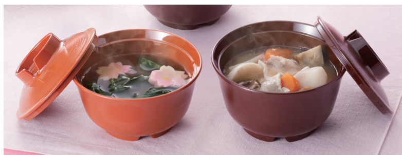
使用食器 | U-61 SYU・U-60 SYU 汁椀、U-63 T・U-62 T 汁椀