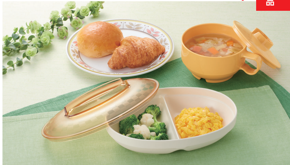
使用食器 | MS-150 CRM パン皿、U-31W MO・U-22 MO スープカップ、U-151W AN・U-152 IV 楕円仕切皿