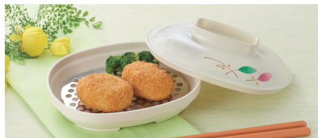
使用食器 | U-149W HNE・U-148 IV 楕円皿、SNK-148 U-148用パンチングすのこ