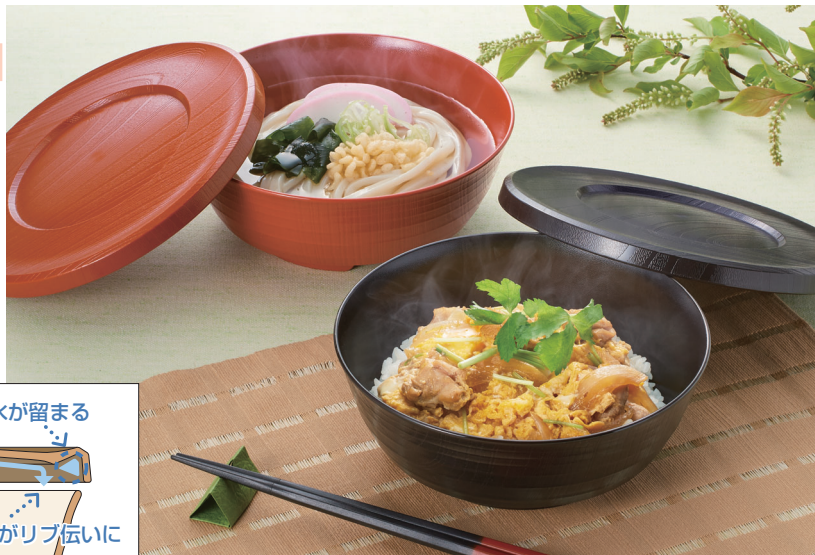
使用食器 | U-97 SYU・U-96 SYU 丼、U-97 KTI・U-96 KTI 丼