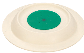
VC-120 IV ピタットくん汁椀用蓋 124×25 ¥1,020