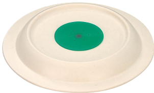
VC-150 IV ピタットくん飯椀用蓋 154×25 ¥1,150