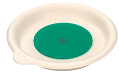
VC-90 IV ピタットくんマグカップ用蓋 101×94×14 ¥900