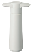
VP-500 手動真空ポンプ ¥2,460