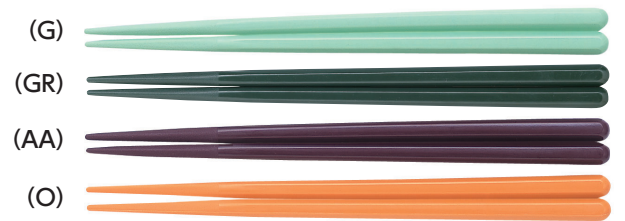
SPH-195S はし 195mm ¥280