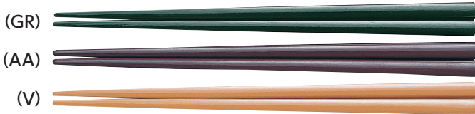
SPH-225 はし 225mm ¥290