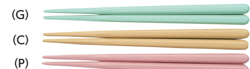
SPH-160S はし 160mm ¥260