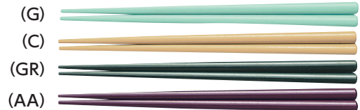
SPH-160 はし 160mm ¥250

グリーン (GR) アズキ (AA) 若草 (G) クリーム (C) ピンク (P) オレンジ (O)