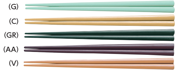
SPH-195 はし 195mm ¥270