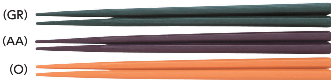
SPH-220S はし 220mm ¥290