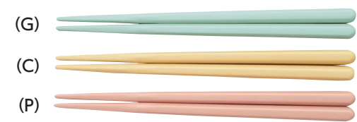
AH-160S はし 160mm ¥260