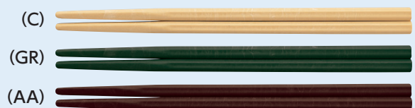
受 AH-185X はし 185mm ¥270