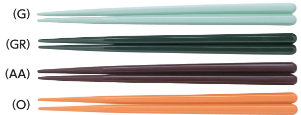
AH-195S はし 195mm ¥280