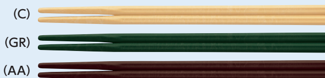
受 AH-205X はし 205mm ¥280