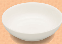
YS-2 W 深小皿 99 × 26・100ml (5/100) ¥740