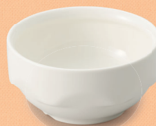
YS-72 W 深皿 90 × 43・160ml (5/100) ¥1,110