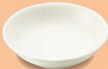
YS-11 W 深皿 132 × 32・200ml (5/100) ¥920