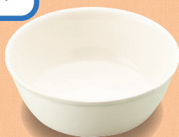
YS-22 W 深皿 106 × 37・160ml (5/100) ¥1,010