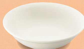
YS-7010 W フルーツ皿 126 × 33 (5/80) ¥920