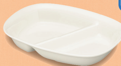
YS-55 W 角仕切皿 167 × 127 × 33 (5/60) ¥1,630