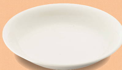
YS-5 W 菜皿 168 × 28 (5/80) ¥1,000