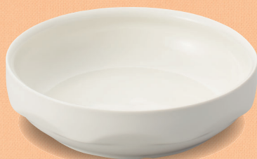
YS-75 W 深皿 145 × 40・450ml (5/60) ¥1,540