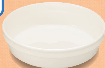
YS-39 W 深皿 143 × 40・400ml (5/60) ¥1,430