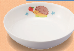
新YS-2 DGS 深小皿 99 × 26・100ml (5/100) ¥900