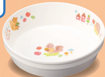
新YS-39 DGS 深皿 143 × 40・400ml (5/60) ¥1,670