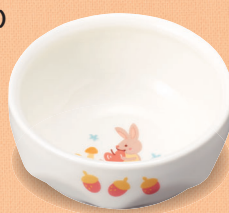
新YS-72 DGS 深皿 90 × 43・160ml (5/100) ¥1,260