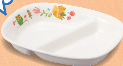
新YS-55 DGS 角仕切皿 167 × 127 × 33 (5/60) ¥1,920