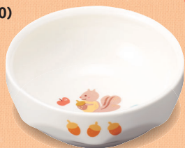
新YS-73 DGS 深皿 105 × 43・230ml (5/100) ¥1,380