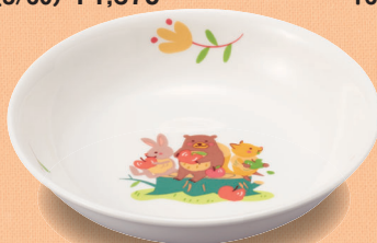
新YS-11 DGS 深皿 132 × 32・200ml (5/100) ¥1,040