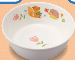
新YS-22 DGS 深皿 106 × 37・160ml (5/100) ¥1,140