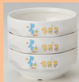
(使用食器：YS-73 FU 深皿)