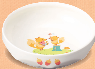
新YS-74 DGS 深皿 130 × 40・350ml (5/60) ¥1,590