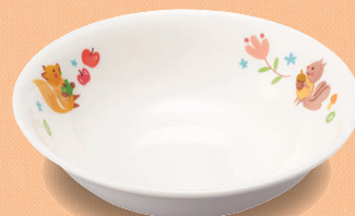
新YS-7010 DGS フルーツ皿 126 × 33 (5/80) ¥1,040