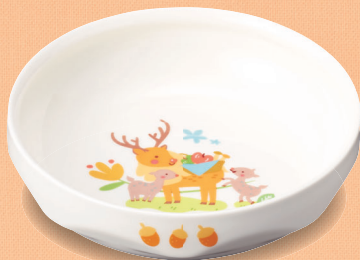
新YS-75 DGS 深皿 145 × 40・450ml (5/60) ¥1,910