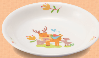
新YS-5 DGS 菜皿 168 × 28 (5/80) ¥1,180