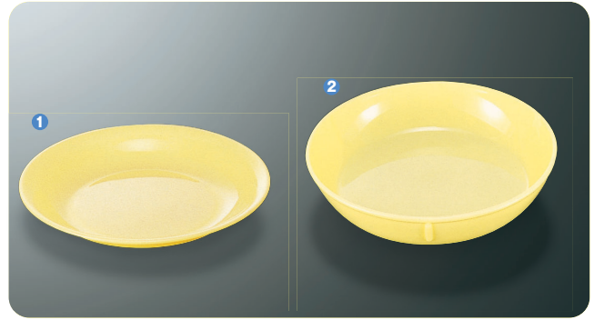
① S-14 C 菜皿 183×25 ¥370