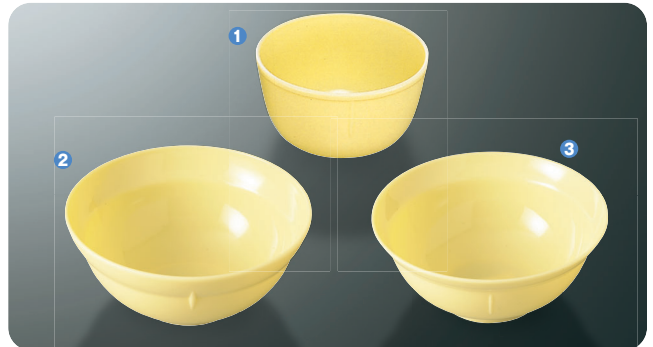
① B-9 C ボール 105×55・325ml ¥290