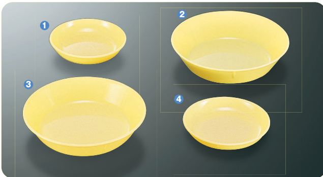
① S-1 C 深皿 97×20・96ml ¥170