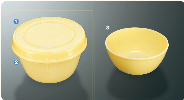
① G-5 C K型飯椀蓋 170×25 ¥440