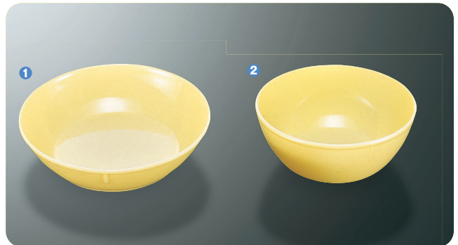
① ▲ G-3 C B型菜皿 170×44・585ml ¥570