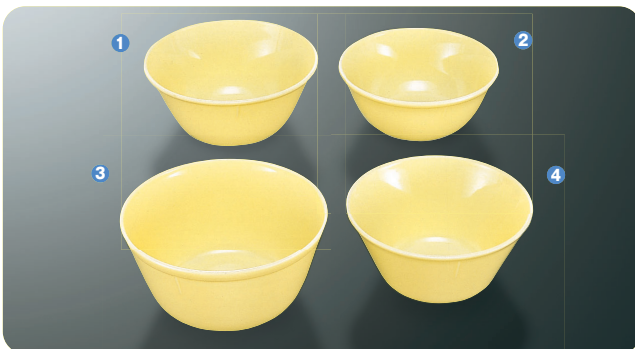
① B-2 C 汁椀 126×56・390ml ¥300